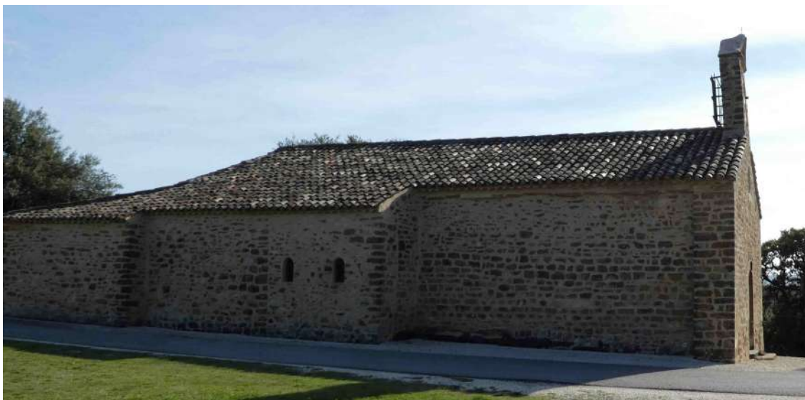
Notre-Dame de Cadenet vue du nord