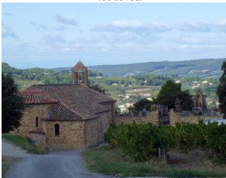
panneau près de l'entrée du cimetière