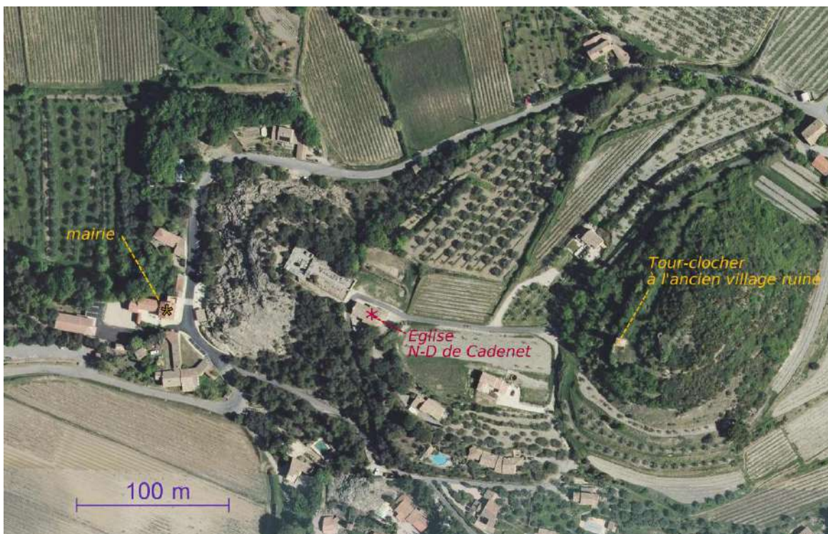
situation d'après une photo-satellite