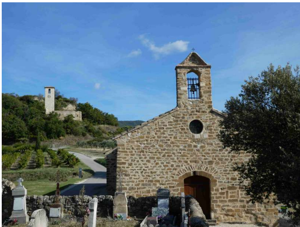
Vue vers l'est depuis le cimetière avec la façade de l'église N-D de Cadenet et au fond la tour-clocher de l'ancienne église paroissiale dans l'ancien village ruiné.

----- Les Amis du Patrimoine des Baronnie -----